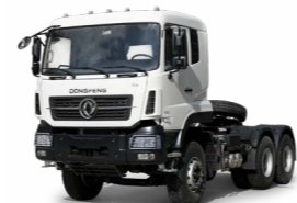
KC 6x4 380 ADR OPTIONNEL