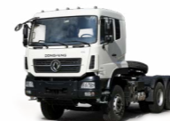
KC 6x4 420 ADR OPTIONNEL