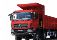
KC 8x4 420 MINIER