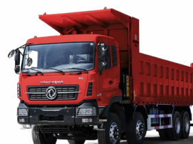
KC 8x4 420 MINIER