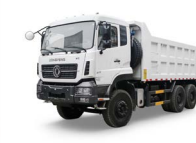
KC 6x4 375