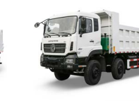
KC 8x4 420