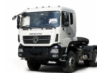
KC 6x4 380 ADR OPTIONNEL

Toutes les photos de ce document sont non contractuelles