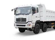
KC 8x4 375