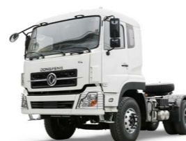
KL 4x2 315