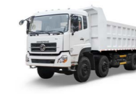
KC 8x4 420