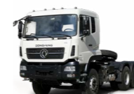
KC 6x4 380 ADR OPTIONNEL