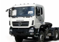
KC 6x4 420 ADR OPTIONNEL