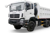
KC 8x4 375