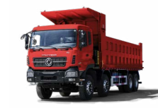
KC 8x4 420 MINIER